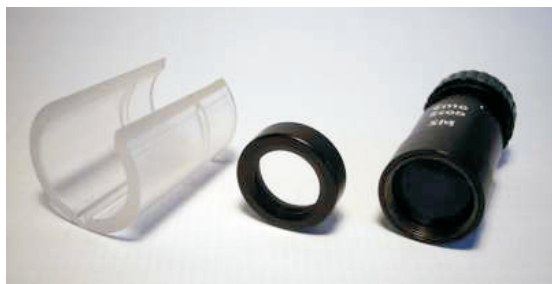
Objektivtubus Metall, Linsen Glas, optisch geschliffen. Inkl. Klarsicht-Mikroskopständer und Lederetui